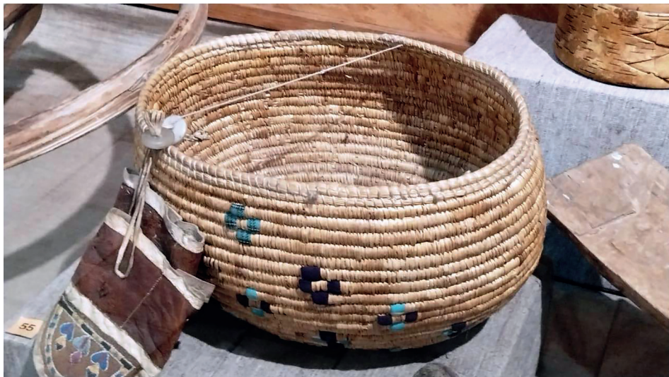
Рис. 4. Традиционная корякская (нымыланская) корзина йыррусгын , предмет «55. Корзина. Растительное волокно. Basket. Plant fiber» из постоянной экспозиции «Предметы материальной культуры оседлых коряков» Камчатского краевого объединённого музея, г. Петропавловск-Камчатский, 2025 г.

на то, что корзины- ляпгав'в'и уже вышли из употребления, слово ляпган является узнаваемым, в частности, оно упоминается в издании «Плетение из травы» [14, с. 28], а также в нымыланско-русском словаре [13, с. 10]. В то же время процесс архаизации лексемы ляпган уже начался. Свидетельством вытеснения данного слова в пассивный фонд алюторского языка является употребление вместо производной лексемы ляпган номинации описательного типа виг'энуткит 21 'травяной мешок'. Примечательно, что утрата архаической лексики касается не только бытовой речи, но и фольклорных текстов. В частности, номинация описательного типа 'травяной мешок' упоминается в тексте мифологической сказки: Пырра гайыр'галлин виг'энуткит — «Мусором набили травяной мешок» (ПМ СФ ИФЛ).