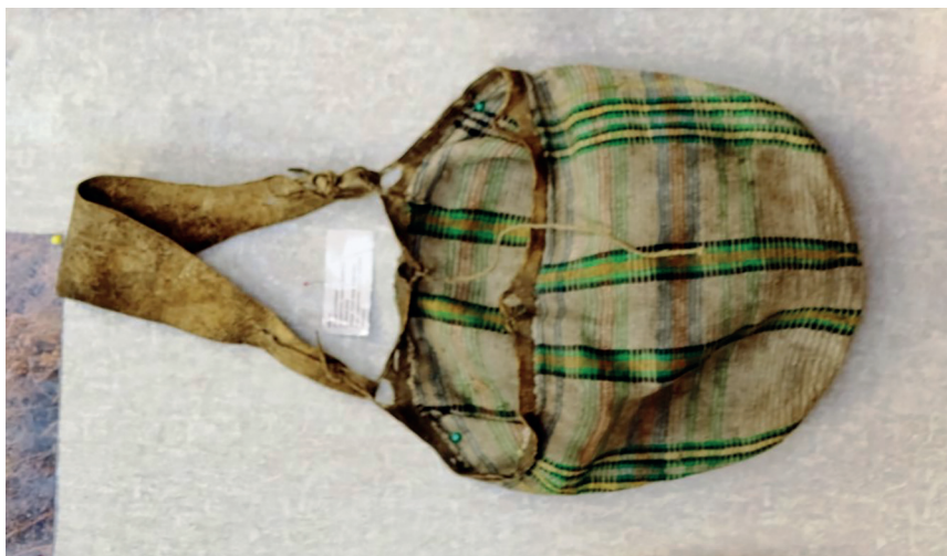
Рис. 6. Традиционная заплечная корзина-сумка манив' ( маниг) с удерживающей налобной лямкой, предмет из постоянной экспозиции Краеведческого музея Олюторского района, пос. Тилички, 2024 г. 24