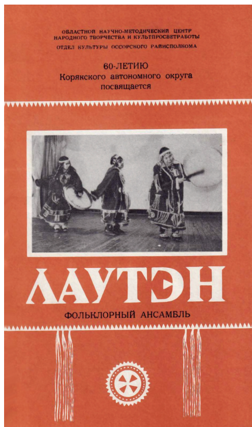
Рис. 1. Обложка буклета о концертной деятельности народного ансамбля «Лаутэн». 1990 г.

Русскоязычное население Камчатки воспринимает слово лаутэн , заимствованное из алюторского языка, прежде всего как