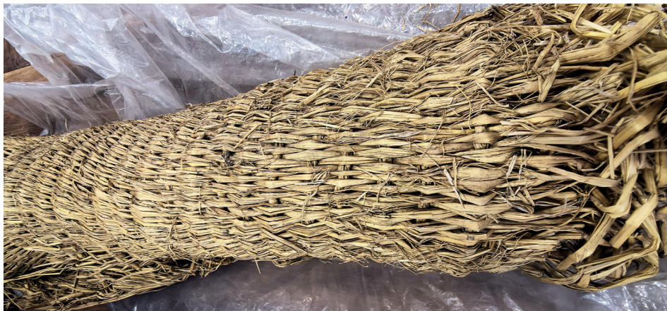
Рис. 3. Настенный травяной коврик исасе в свёрнутом виде, предмет из коллекции Краеведческого музея Олиторского района, пос. Тиличики, 2024 г. 16

Лексема йыррусгын используется в современной бытовой речи коряков-нымыланов: Җомат 17 , уса-ки җытатгын ынун йыррусгын! — «Родственница, дай-ка эту корзинку!» 18 . На современном этапе развития алыторского языка морфемная структура слова йыррусгын определяется как неделимая. Исторически формирование данного слова связано с глаголом йырзатык ‘наполнять какую-л. ёмкость’ и суффиксом -русг (-йусг) 19 ‘наполнение’, т. е. йыррусгын буквально означает ‘ёмкость для наполнения’.