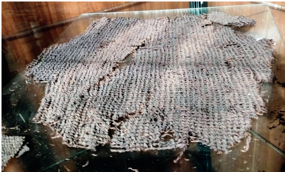
Рис. 9. Фрагмент ительменского травяного коврика чирэл , предмет «5. Образец плетения. Растительное волокно. Pattern of textile. Plant fiber» из постоянной экспозиции «Предметы материальной и духовной культуры ительменов» Камчатского краевого объединённого музея, г. Петропавловск-Камчатский, 2025 г.

ским словом тувэйк , которое приведено в ительменско-русском словаре: « Тувэйк — сущ. ‘трава, растущая вдоль берега моря’» [15, с. 245]. Из ительменского языка коряки-нымыланы заимствовали слово лямган ‘большая заплечная корзина-сумка для переноса тяжестей с удерживающей налобной лямкой’. В ительменско-русском словаре отражена соответствующая лексема: « Лэпхэ (мн. лэпхэ?н ) — сущ. ‘травяная корзина или мешок (для ягод, сараны, кимчиги); <...> мешки делают из травы, их носят на спине, а ремень надевают на голову; в мешки кладут ягоды (и корешки), (а также) детей, чтобы носить их’» [15, с. 155—156]. Закономерно, что приведённые аллоторские лексемы, имеющие ительменское происхождение, отсутствуют в языке коряков-чавчуенов.